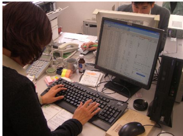
組合員からの安否確認の返信ハガキをパソコンに入力する